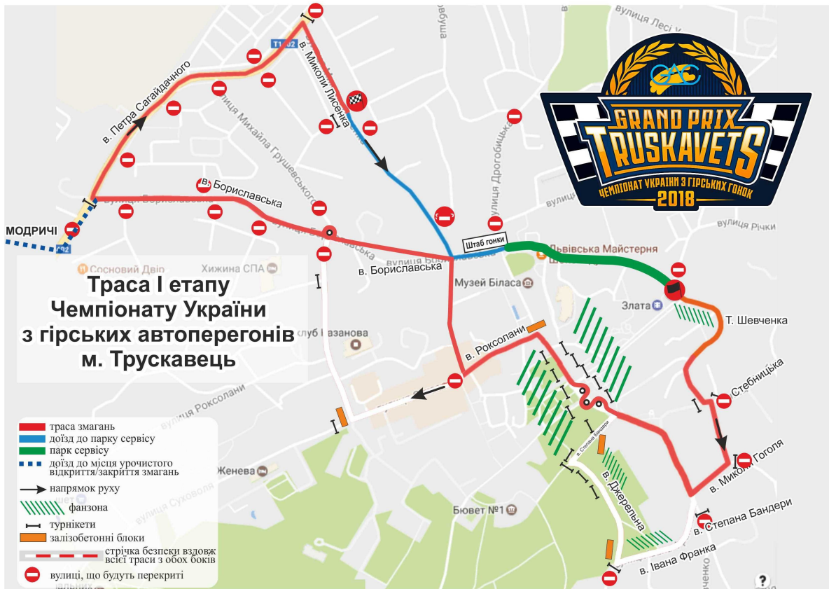
СХЕМА ПАРКУ СЕРВІСУ